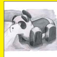
デパートの 屋上にいたあの子