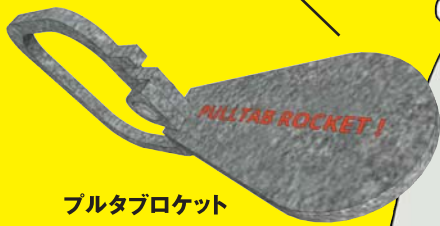
ブルタブロケット